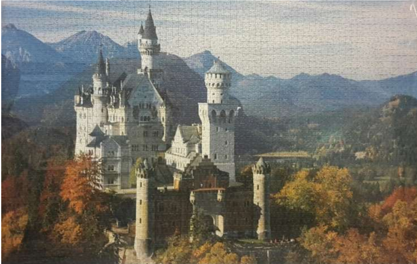
Castello di Neuschwanstein (Baviera)

Riferimenti: silvia.ialongo@agenziaentrate.it